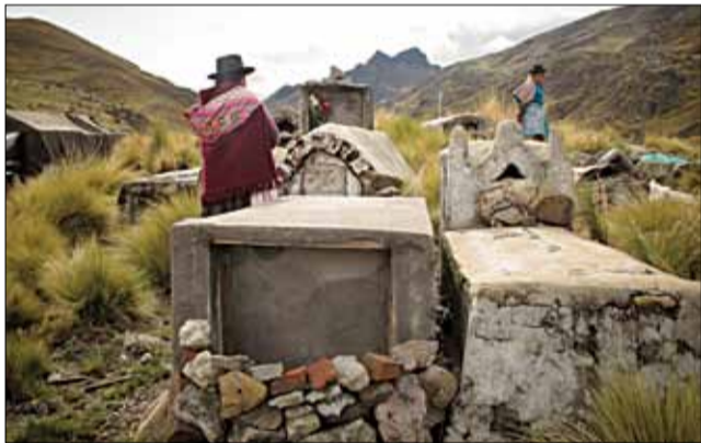
Нябожчыкаў тут не закопваюць у камяністую зямлю. Магілу надбудоўваюць над зямлёй.