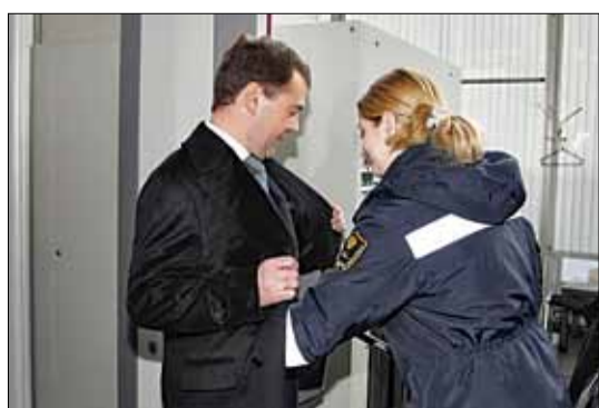
Прэзідэнт Расіі Дзмітрый Мядзведзеў асабіста правяраў сістэму бяспекі на Кіеўскім вакзале Масквы і ў аэрапорце Унукава.

Ён сышоў у баевікі пасля зачысткі ў ягоным ауле.