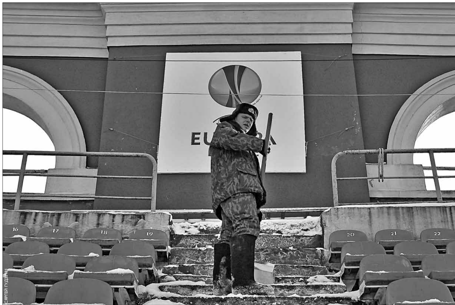
У 20-градусны мароз у ачыстыя стадыёна ад снегу задзейнічаныя спецназаўцы тэрміновай службы.

Ад 3D-тэлебачання дыскамфорт будзе значна большы, чым у кіно, бо экран знаходзіцца яшчэ бліжэй да глядача.