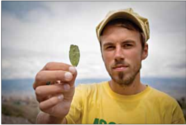
У Перу кока — легальная.