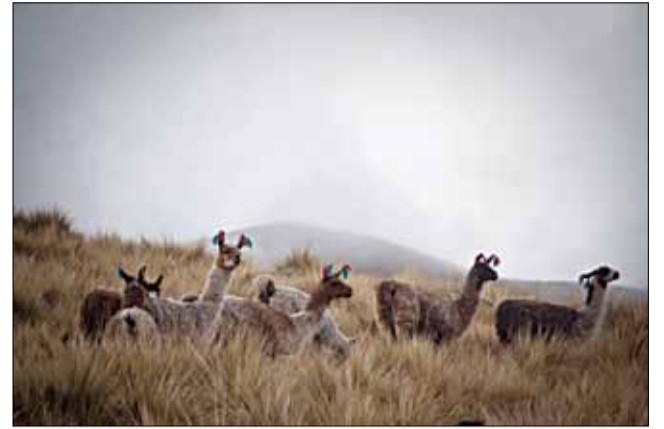
Лам у гарах разводзяць на роўных з авечкамі і быдлам.