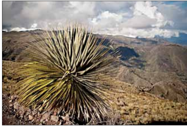
Юка ў Андах.