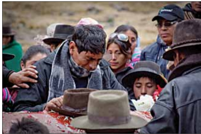
У апошні шлях.