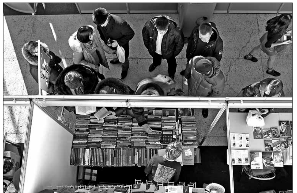
Ля стэндаў беларускіх выдавецтваў было нямала наведвальнікаў.