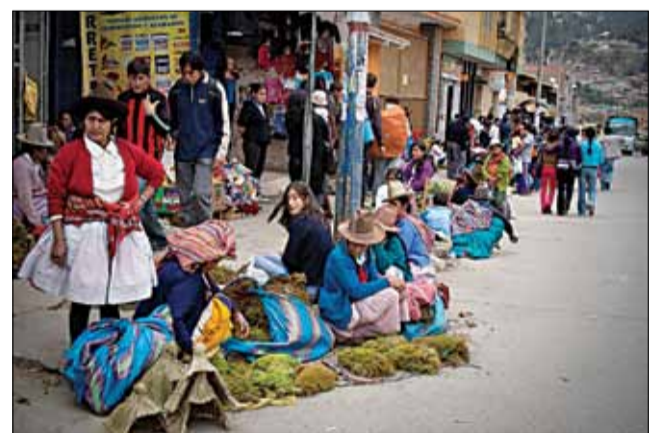
Перад Нараджэннем Хрыстовым прадаюць мох для батлейкі.

Амаль да паўночы мы спявалі песні. Некаторыя пазасыналі на скурах. Роўна а 12-й тый, хто яшчэ не спалі, павіншавалі адно аднаго з Раством. І мы заснулі, накрытыя аўчынкамі і з прысмакам кокі за шчакай.