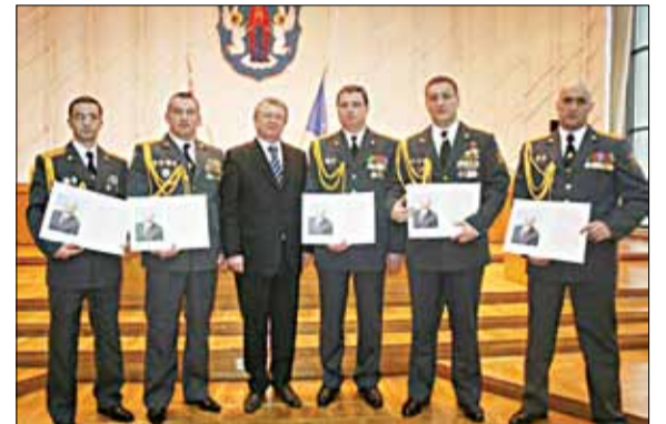
Узнагароджаныя за грамадскі парадок.