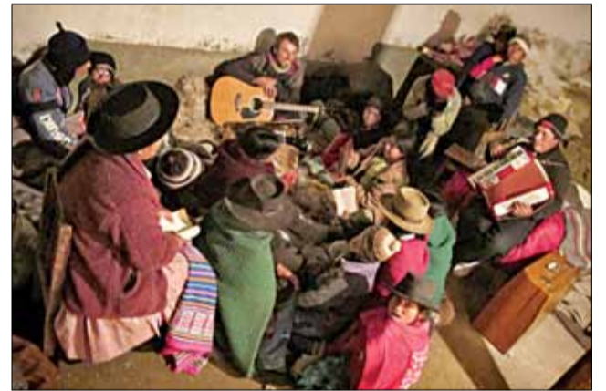
Спевы на хаўтурах.