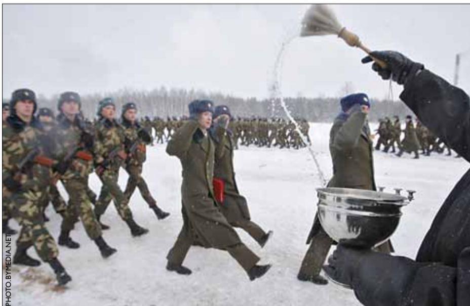
Сем з паловай тысяч маладых салдатаў зімовага прызыву прынялі прысягу на вернасць Беларусі.