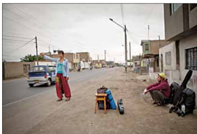
Аўтаспын у Перу.