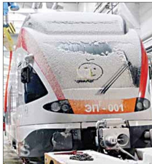
Беларусь набыла швейцарскія гарадскія электрычкі мадэлі Flirt, коштам каля 6 млн еўра кожная. Цяпер цягнікі збіраюць у лакаматыўным дэпо Баранавічаў.