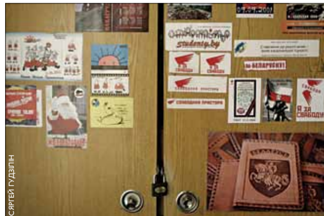
Наглядная агітацыя. Жывы архіў.

«НН» з радасцю друкуе ў газеце і на сайце www.nn.by чытацкія лісты, водгукі і меркаванні. З прычыны вялікага аб'ёму пошты мы не можам пацвярджаць атрыманне Ваших лістоў, не можам і вяртаць неапублікаваныя матэрыялы. Рэдакцыя пакідае за сабой права рэдагаваць допісы. Лісты мусяць быць падпісаныя, з пазнакай адраса. Вы можаце дасылаць іх поштай, электроннай поштай ці факсам. Наш адрас: а/с 537, 220050 Мінск. e-mail: nn@nn.by.