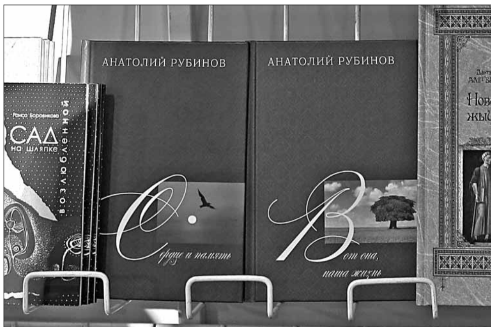
«Літаратура і мастацтва» прэзентавала неўміручыя кнігі Анатоля Рубінава.

Дзяржаўны сакратар саюзнай дзяржавы гуляе з дзецьмі ў футбол. Дзяржаўны сакратар саюзнай дзяржавы адпачывае з дзецьмі на канале... Эксклюзіўны альбом, праўда, не прадаваўся. Яго выставілі на кірмашу адмыслова для азнаямлення з працоўнымі буднямі Паўла Барадзіна.