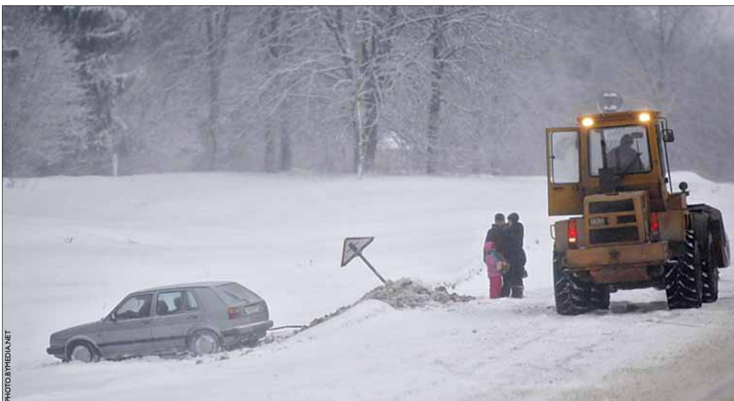
Рэзкае пахаладанне і снягі ўтварылі небяспечную слізгату на дарогах.