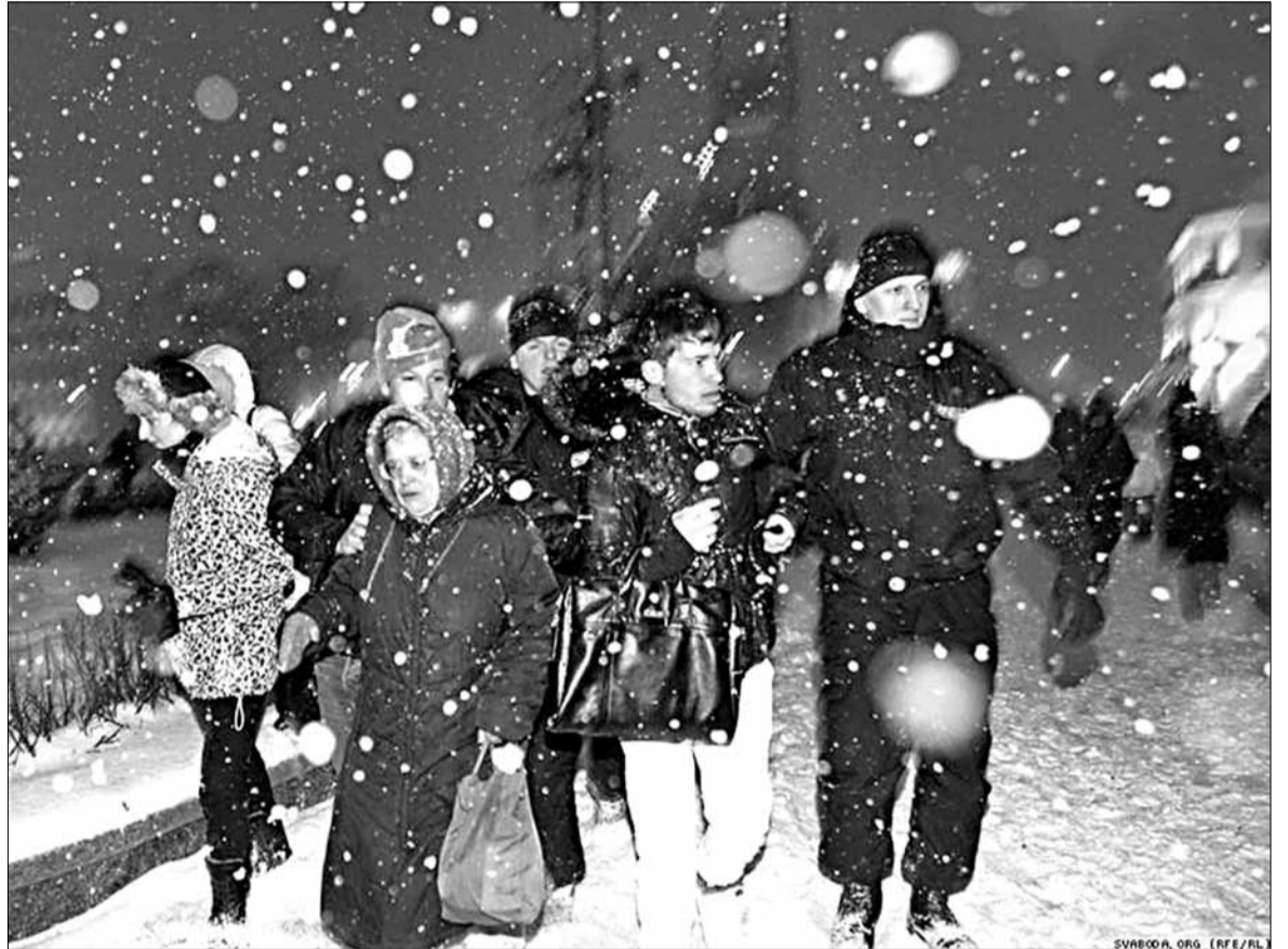
Усіх у аўтазак — 20 снежня.

бо я папросту не разумееў судзію. Яна была далёка ад мяне, і я не мог зразумець, што яна кажа. Суд перанеслі на некалькі гадзінаў пазней, і выклікалі мяне сурдаперакладчыка. Дарэчы, у судзе мне нарэшце дазволілі патэлефанаваць родным.