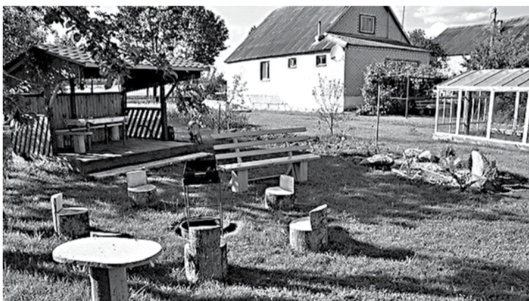
«У Нічыпараў» — ідэальны парадак.

Т.: (02156) 36-357; (029) 109-51-89 (Юлія Бука).