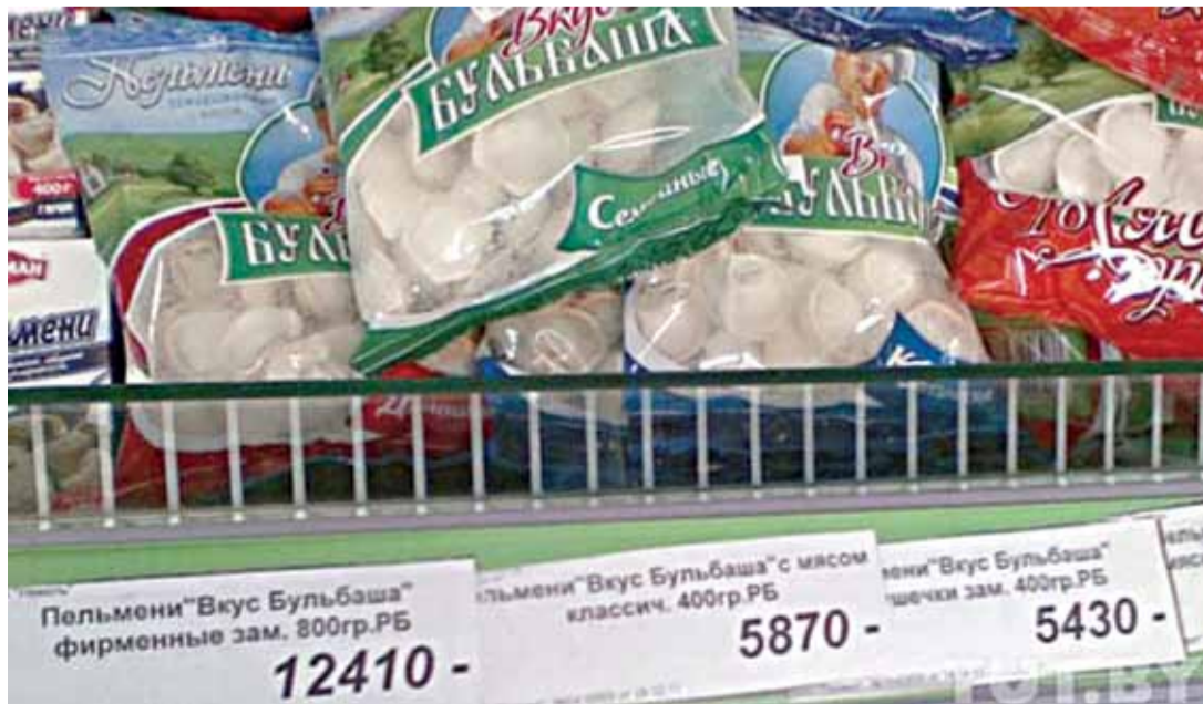
На паліцах беларускіх крамаў з'явіліся пельмені «Вкус бульбаша». Без каментароў.