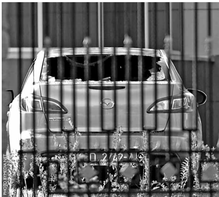
Спаленая машына на тэрыторыі расійскага пасольства ў Мінску.