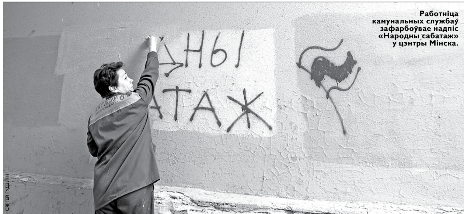
Работніца камунальных службаў зафарбоўвае надпіс «Народны сабатаж» у цэнтры Мінска.

— Дурненькая! — Толік яшчэ мацней абхапіў жонку і ўсміхнуўся: — Робат жа не звер: два допыты за адну ноч не агорае. — Ну, нічога, — ён соладка пазяхнуў, — разбагацеем, дык купім у дом больш магутную мадэль, каб хадзіць на начныя допыты разам.