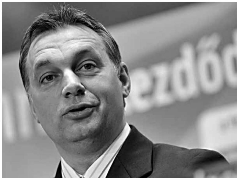
Прэм'ер Віктар Орбан усё больш схіляецца да аўтарытарных метадаў.

Аўтар дзякуе прадстаўніцтву Еўракамісіі за дапамогу ў напісанні гэтага матэрыялу.