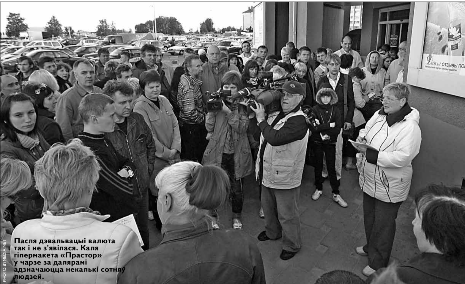
Пасля дэвальвацыі валюта так і не з'явілася. Каля гіпермаркета «Прастор» у чарзе за далярамі адзначаюцца некалькі сотняў людзей.