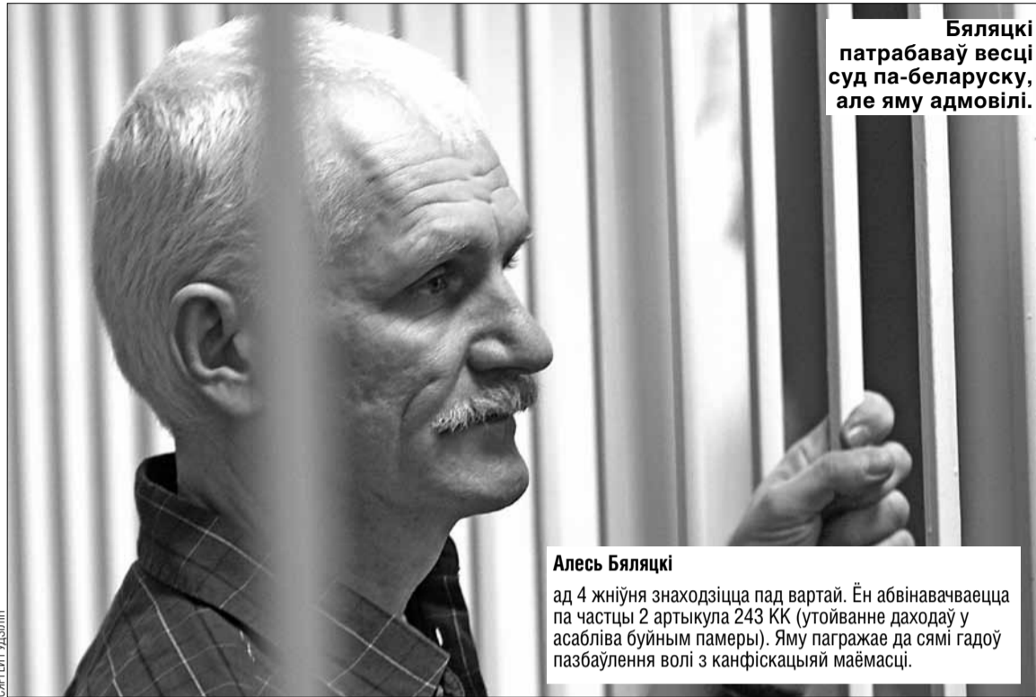
Бяляцкі патрабаваў весці суд па-беларуску, але яму адмовілі.

Праз колькі дзён КДБ звярнуўся да старшыні КДК Зянона Ломана-