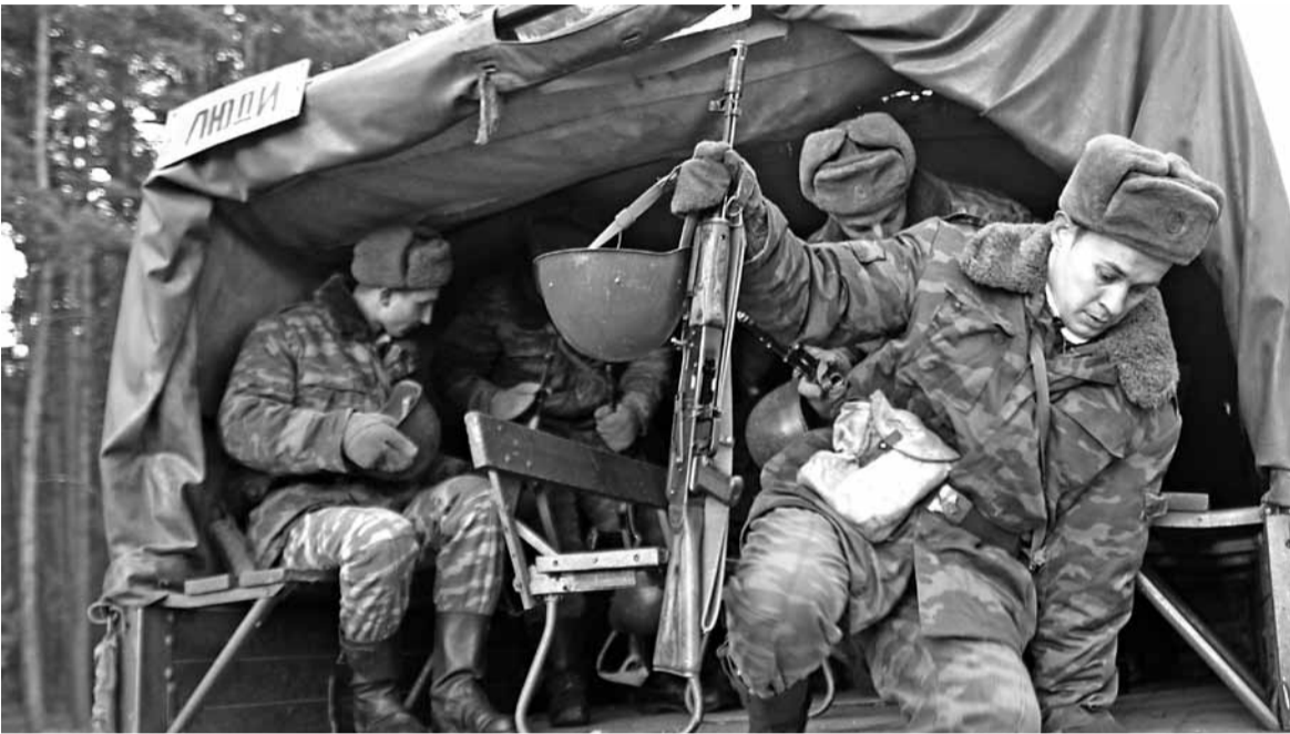
Цяпер беларусам давядзецца часцей выязджаць на вайсковыя зборы.

«Тэрытарыяльная абарона павінна набыць агульнадзяржаўны і ўсенародны характар», — кажа Лукашэнка.