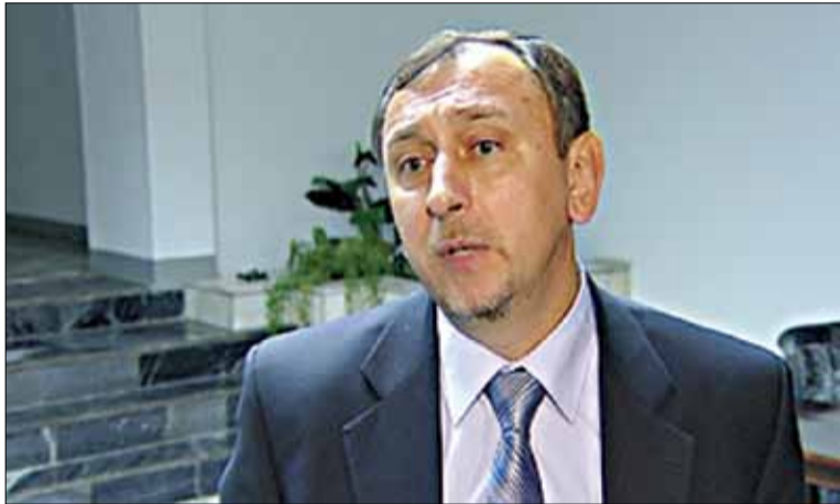
Намеснік міністра эканомікі Аляксандр Ярашэнка адважыўся супярэчыць памочніку Лукашэнкі.