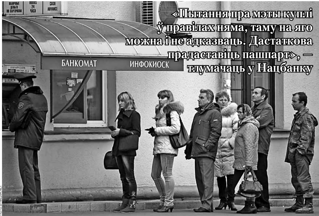
Калі купляць валюту ў банкамаце, пашпартныя дадзеныя ўсё адно трапяць у агульную базу.

«Пытанні пра мэты куплі ў правілах няма, таму на яго можна і не адказваць. Дастаткова прадставіць пашпарт», — тлумачаць у Нацбанку