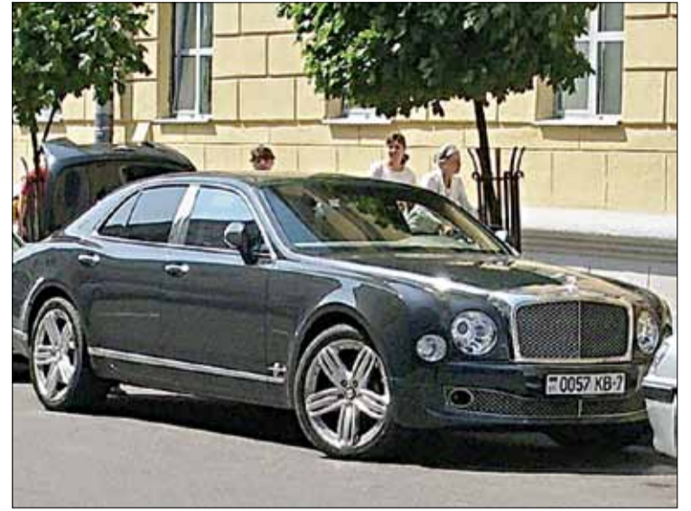
Самым дарагім серыйным аўтамабілем, які быў заўважаны ў Мінску, з'яўляецца Bentley Mulsanne. Яго аўтары ставілі перад сабой задачу стварыць «самы раскошны з усіх брытанскіх аўто». Арыенціровачны кошт такой машыны — 550 тысяч даларуў.