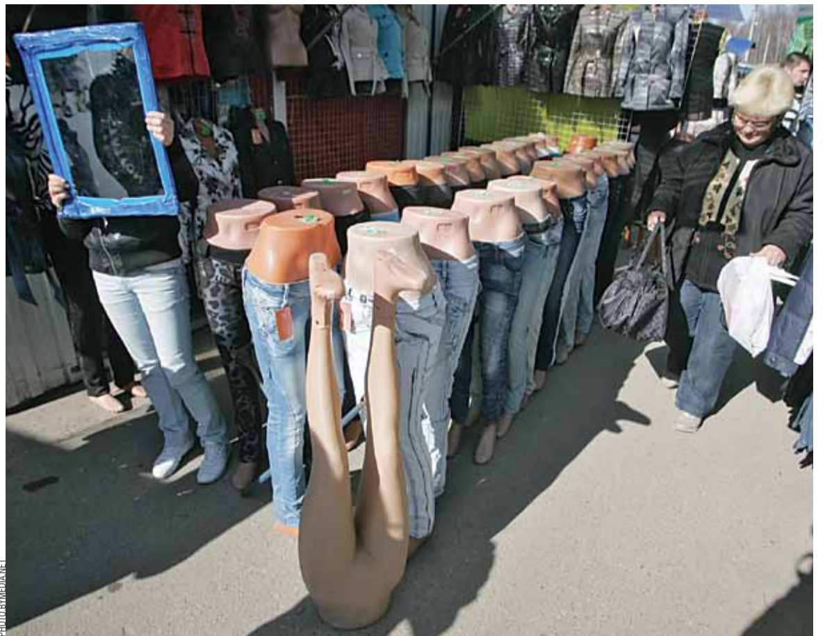
У Гродна едуць па танныя польскія тавары.

Візы і чэргі, а таксама абмежаванне на перасячэнне мяжы на аўто раз на пяць дзён не менш за праблемы з валютай ускладняюць жыццё прадпрымальнікам. І