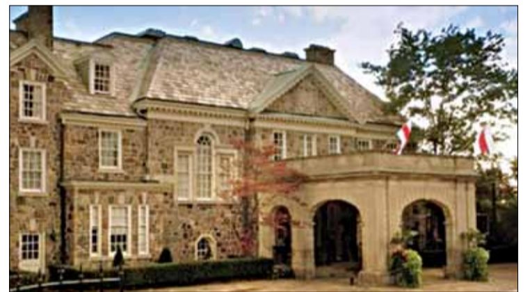
Над рэзідэнцыяй кіраўніка Беларусі бел-чырвона-белыя сцягі. Такой нашу краіну ўбачылі стваральнікі амерыканскага серыяла «Нікіта».