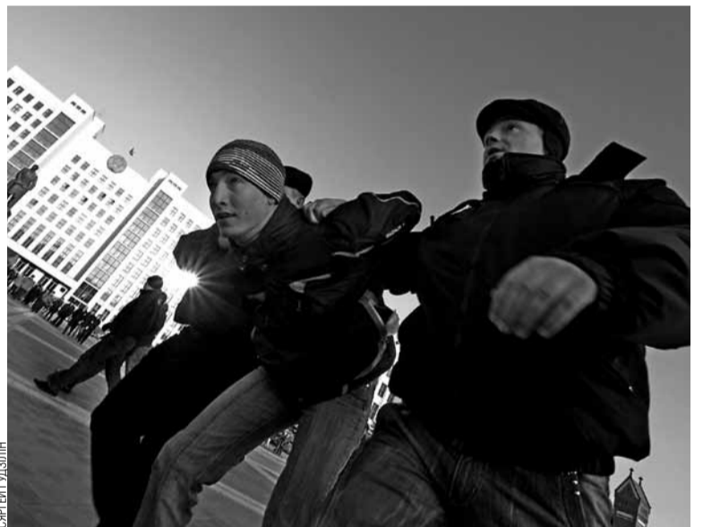
Юнакі атакавалі камуністычны мітынг у Мінску 7 лістапада. «Спыніць камунізм» і «Камунізм — пад трыбунал», — скандавалі яны. Хлопцаў з «Маладога фронту» потым асудзілі да адміністрацыйных арыштаў.