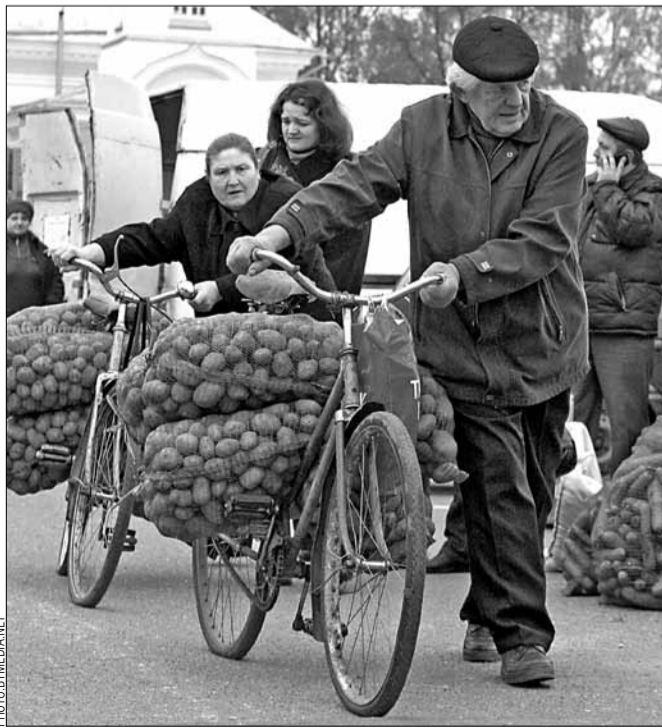
У беларускіх пенсіянераў свая валюта — бульба.